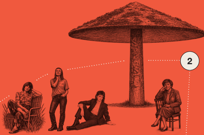
Toni-Steingass Park Köln-Nippes