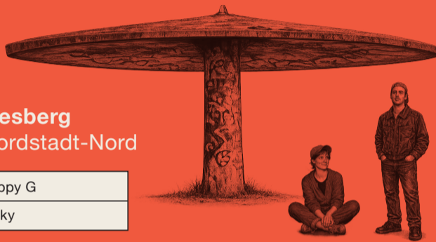
Herkulesberg Köln Nordstadt-Nord